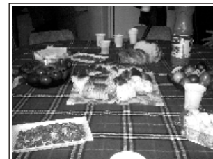
"Всички заедно - и на празник, и в делник" - учителският колектив от СОУ - Сатовча споделят празничните чувства и възвращения на богата великденска трапеза